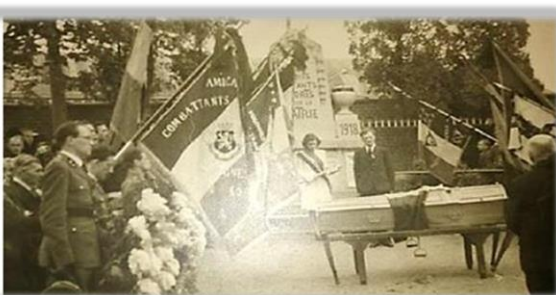
L'emplacement du monument aujourd'hui L'hommage à une victime au même endroit